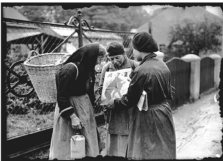
Abb.8: Eugen Heilig: Landagitation, Verkauf der AIZ (1931), Fotografie.

entwickelte sich die Motivation der AIZ, dass sich auch innerhalb der Zeitschrift, ihrer Aufmachung und der fotografischen Arbeit etwas ändern müsse. Es gäbe zu viel Theorie und zu wenig Bilder, was auch den Unterhaltungsfaktor schmälere. Bis Mitte der 1920er Jahre wurde die Illustrierte zur Aufklärung genutzt, um den Menschen die marxistisch-leninistische Weltanschauung, ebenso wie politisch-ökonomische Verhältnisse zu vermitteln. 11 Die AIZ, die zwar mit der KPD sympathisierte, aber kein offizielles Organ der Partei war, verfolgte im Gegensatz zu KPD ein etwas anderes propagandistisches Konzept als die Partei. Ihr Ziel war die Unterstützung und Förderung des proletarischen Klassenkampfes und war offen für alle Menschen ähnlicher Gesinnung. 12 Sie wollte der „Verdummung“ durch die bürgerliche Presse entgegenwirken, jedoch ohne dabei zu manipulieren. Adressaten waren die Arbeiter*innen, Kleinbürger*innen und die Intellektuellen. Der Einsatz des Bildes wurde zur Voraussetzung der politischen Aufklärung. Die AIZ wollte nicht zu den Illustrierten gehören, die nur leere, politische Parolen wiederholten, sondern eine neue Form der Presse kreieren, die die Lebenswelt der Leser*innen mit all ihren Problemen und Bedürfnissen darstellt.