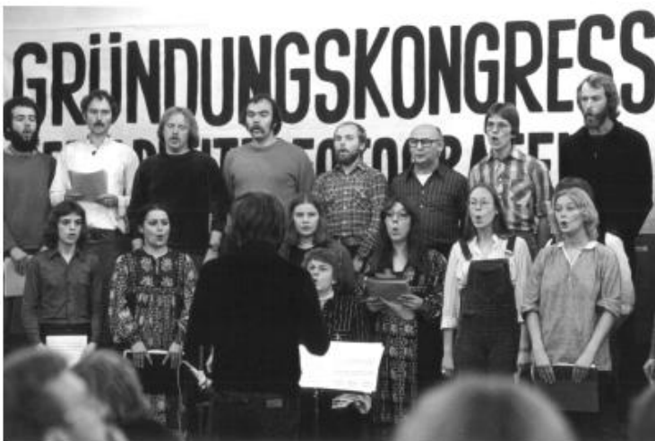
Abb.13: Gründungskongress des Verbandes Arbeiterfotografie e.V. (1978), Fotografie.

Die erste Ausgabe der Zeitschrift wurde maßgeblich von der Hamburger Gruppe gestaltet. Bereits in der zweiten wurde jedoch um Beiträge in Schrift und Bild von Arbeiter*innen deutschlandweit gebeten. Das Blatt wurde zum Informations- und Diskussionsforum für Arbeiterfotografen, ebenso wie zum kollektiven Organisator der