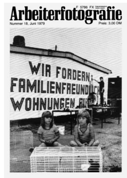
Abb. 128: Titelbild: aus dem Artikel: 'Wir fordern familiengerechte Wohnungen - eine Bürgerinitiative berichtet über ihre Öffentlichkeitsarbeit', Arbeiterfotografie Nr.18 (1979).

Wie auch das historische Vorbild aus der Weimarer Zeit, zeichnete sich die neue Arbeiterfotografie in der Bundesrepublik der 1970er Jahre im Verhältnis zu politischen Parteien durch zwei Merkmale aus: 1. Sie verstand sich als unabhängige, parteiübergreifende Organisation. Die Mitglieder hatten eine sozialistische, demokratische Grundhaltung inne. 2. Sie war, ebenfalls, ähnlich wie die AIZ und der Arbeiter-Fotograf , an eine politische Partei angelehnt. Was in der Weimarer Zeit die KPD für die AIZ war, war die DKP für die Arbeiterfotografie . Inhaltlich diente die Zeitschrift als Widerhall der gesellschaftspolitischen Entwicklungen, zuerst in der BRD und später im wiedervereinten Deutschland. Auch in ihrer ideologischen Ausrichtung berief sie sich auf die Tradition der Arbeiterfotografie der Weimarer Zeit und übernahm deren argumentative Grundmuster. 18 Die Arbeiterfotografie warf ebenfalls den bürgerlichen Medien Verschleierung der Wahrheit vor. „Dieser ‚Flut von Bildern‘ soll[t]e eine ‚realistische Fotografie‘ entgegengesetzt werden und damit menschliche und materielle Probleme bewusst gemacht werden“. 19 Die Rhetorik der Arbeiterklasse aus der Weimarer Zeit wurde deutlich fortgeführt und ebenso wurde der