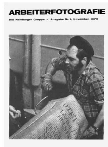
Abb.11: Titelbild: aus der Reportage 'Hamburger Hafen', Arbeiterfotografie Ausgabe Nr.1 (1973).

blieben einige Missstände bestehen. So waren weiterhin Streiks und Kämpfe für die Rechte der Arbeiter notwendig, um ihre Forderungen durchzusetzen. Wie bereits in der Weimarer Republik gab es auch hier eine ideologische Verankerung. Lange Zeit war die Arbeiterfotografie ideologisch und finanziell mit der Deutsche[n]