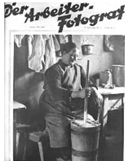
Abb. 7: Titelblatt: Der Arbeiter-Fotograf , II. Jahrgang, Nr. 11 (1928), Fotocollage.

Arbeiterklasse eine Plattform, sich untereinander auszutauschen, zu organisieren, mitzuarbeiten und gab ihnen eine Stimme, mit der sie die Missstände ihrer Arbeits- und Lebensbedingungen aufzeigen konnten. Bisher war das in diesem Ausmaß nicht möglich gewesen. Das Bürgertum der Weimarer Zeit, wie auch davor, interessierte sich nicht sonderlich für die eher benachteiligten Klassen. Auf die sozialen Kämpfe der Zeit und die Lage der Arbeiter*innen in der Gesellschaft wurde bis dahin auf zwei Weisen begegnet: sie wurden entweder ausgeblendet und mit Schweigen gestraft oder wiederum romantisiert und dadurch die eigentliche Lage entschärft. Die sozialen Missstände wurden verklärt und als Idylle dargestellt, obwohl Elend und Verfall vorherrschten. Die höheren Gesellschaftsschichten wollten das Übel weder sehen, noch sich damit befassen. 10