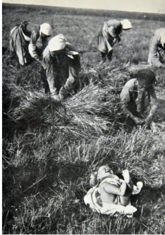
Abb. 5: U. B.: Alle Hände sind beschäftigt (1931), Fotografie.

Die AIZ hatte eine besondere Stellung in der deutschen Presse und war in vielerlei Hinsicht Vorreiter: ob in der Verbreitung und Nutzung von Fotografie oder der politischen und ideologischen Ausrichtung. Die AIZ bot den Menschen der