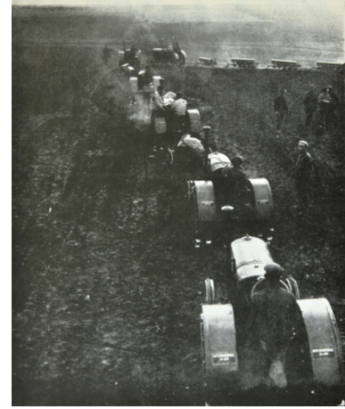
Abb. 7: U. B.: Wir pflügen um den alten Boden und bauen eine neue Welt (1931), Fotografie.

Arbeiterklasse eine Plattform, sich untereinander auszutauschen, zu organisieren, mitzuarbeiten und gab ihnen eine Stimme, mit der sie die Missstände ihrer Arbeits- und Lebensbedingungen aufzeigen konnten. Bisher war das in diesem Ausmaß nicht möglich gewesen. Das Bürgertum der Weimarer Zeit, wie auch davor, interessierte sich nicht sonderlich für die eher benachteiligten Klassen. Auf die sozialen Kämpfe der Zeit und die Lage der Arbeiter*innen in der Gesellschaft wurde bis dahin auf zwei Weisen begegnet: sie wurden entweder ausgeblendet und mit Schweigen gestraft oder wiederum romantisiert und dadurch die eigentliche Lage entschärft. Die sozialen Missstände wurden verklärt und als Idylle dargestellt, obwohl Elend und Verfall vorherrschten. Die höheren Gesellschaftsschichten wollten das Übel weder sehen, noch sich damit befassen. 10