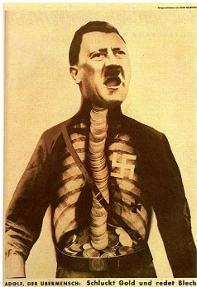
Abb. 3: John Heartfield: Adolf, der Übermensch: Schluckt Gold und redet Blech (1932), Titelfbild der Arbeiter Illustrierte Zeitung (AIZ), Fotomontage.

Das Neue bei der AIZ war, dass die Titelfotos bis zum Seitenrand reichend abgedruckt werden konnten. Dadurch wurde auch der visuelle Ausdruck des Dargestellten erheblich gesteigert und die Zeitschrift damit attraktiver. Einen großen Teil der Titelfotos, die meist aus Fotomontagen bestanden, entwarf der Dada-Künstler John Heartfield (1891-1968) für die Zeitschrift. Der massive Einsatz dieser Fotomontagen war ein charakteristisches Moment für die AIZ. Fotomontagen erlebten ihren Höhepunkt in der sozialistischen Bewegung und haben dort bis heute ihren festen Platz. Diese tauchten zunächst überwiegend auf Buchumschlägen auf. Führend auf diesem Gebiet war Heartfield, der