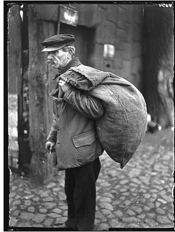
Abb. 6: Eugen Heilig: Der Schaler (1932), Fotografie.