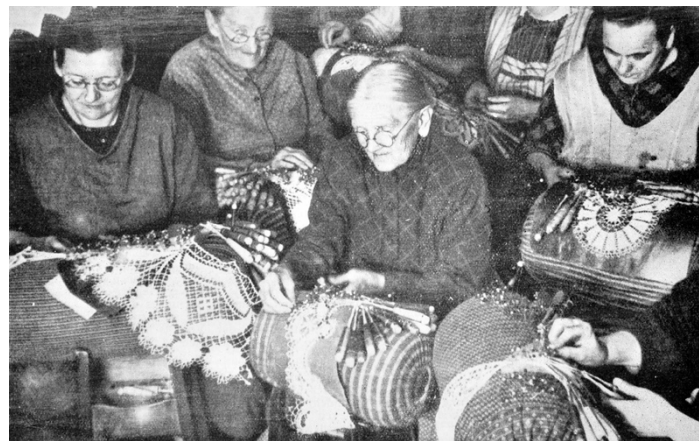
Abb. 1: M. W.: Viel Mühe, wenig Lohn (1930), Fotografie

Bilder wie das von an Stickerarbeiten arbeitenden, älteren Frauen, die für ihre schwere und langwierige Arbeit viel zu wenig Lohn erhielten, sollten die Gesellschaft aufrütteln. Die Zustände mancher Menschen sollten verdeutlicht werden und ein Umdenken bewirken. Dies ist nur eines von vielen Beispielen. In der frühen Fotografie, also seit Ende des 19. Jahrhunderts, gab es keine wirkliche Auseinandersetzung mit der Arbeiterklasse. 2 Entweder sehr selten oder in jeglicher Form unrealistisch, wurden die Lebens- und Arbeitsumstände dieser Gesellschaftsklasse in der Fotografie gezeichnet. 3 Und eben dieser Zustand begann sich zu verändern.