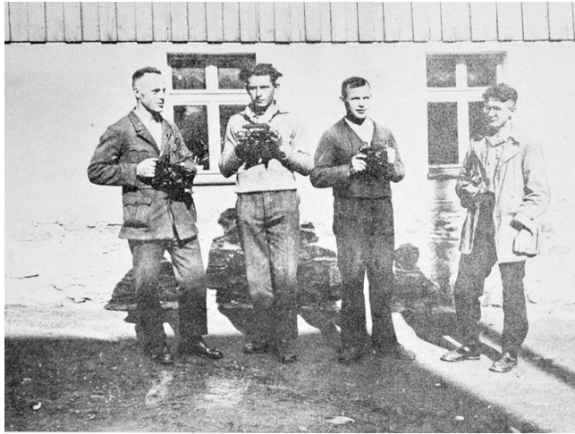
Abb.10: Kurt Beck: Die Bermsgrüner Arbeiterfotografen (1931), Fotografie.

Die Arbeiterfotografie war ein kollektives Projekt mit einer Vielzahl von unterschiedlichen Fotograf*innen aus unterschiedlichen Gruppen. Die Fotografien erschienen meist ohne Autorenvermerk oder nur mit Namenskürzeln versehen. Auf diese Art und Weise sollten die Fotografen vor Repressalien durch ihre Arbeitsgeber oder die Behörden geschützt werden. Die Tätigkeit der