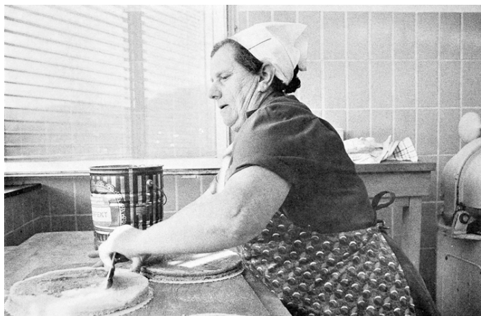
Abb.14: Arbeiterfotografie-Gruppe Marburg: Mensaangestellte bei der Arbeit (1978), Fotografie.

Angestellten bei der Arbeit zeigten, ebenso wie eine kurze Notiz über die Funktion dieser Tätigkeit für die Universität. Der Titel lautete: „Funktion der nichtwissenschaftlichen Arbeit für den Wissenschaftsbetrieb“. 26 Aber auch die Missstände, die diese Berufe mit sich brachten, wurden kurz erwähnt. Ob nun